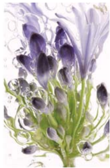
ADMG agapante 2

Mes visuels renoncent à toute ombre portée et à toute perspective, obéissant ainsi au principe de l'herbier, qui est une mise à plat d'une matière rendue quasi transparente. Travailler dans un environnement sombre me permet de voir ce que mon oeil ne perçoit pas en temps normal. Chacune de mes prises de vues devient alors un sujet d'étonnement et de surprise. Chaque nouvelle découverte contribue pour beaucoup à mon contentement.