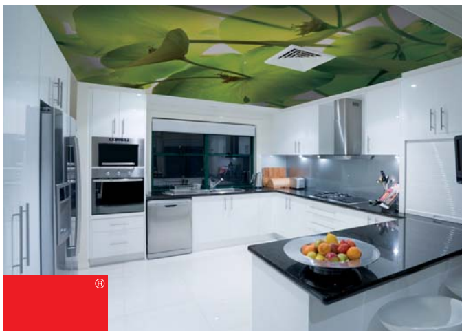
ADREA ADMG euphorbes