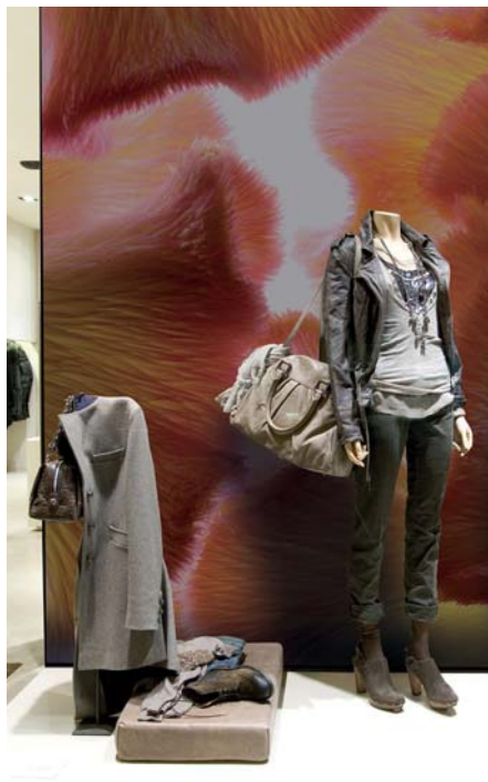
ADREA ADMG celosie