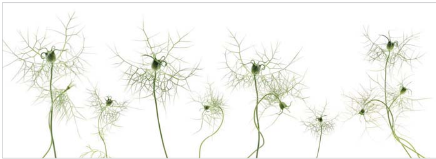
ADMG calice de nigelle 2