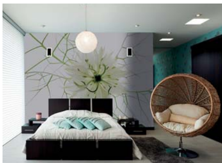
ADMG nigelle blanche 2 ADMG reine marguerite