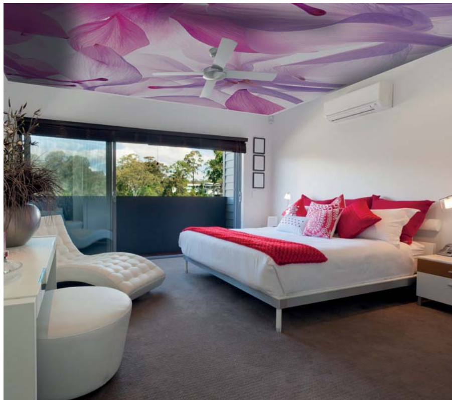
ADREA ADMG ancolie

Michel Gantner pour ALYOS , le 26 mai 2014