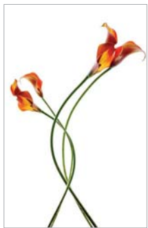
ADMG arum 2