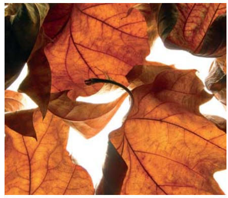
ADMG feuille de platane