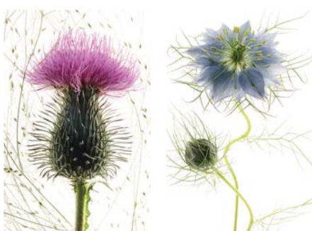
ADMG chardon sauvage ADMG nigelle bleue