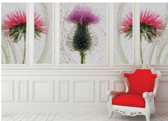
ADREA ADMG chardon sauvage et reine marguerite