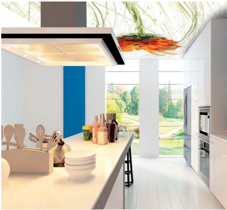
ADREA ADMG roi velour