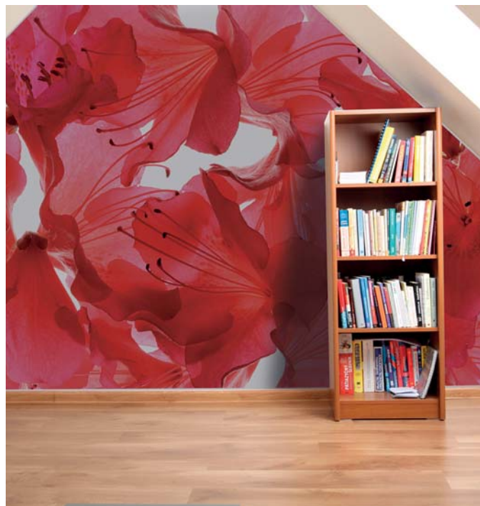
ADREA ADMG rhododendron