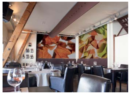
ADREA ADMG feuilles de platane et d'automne