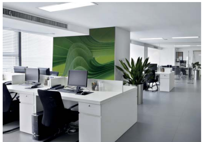
ADREA ADMG hosta