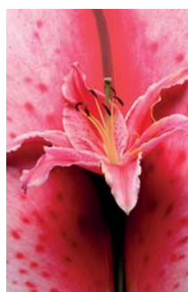
ADMG lys rouge