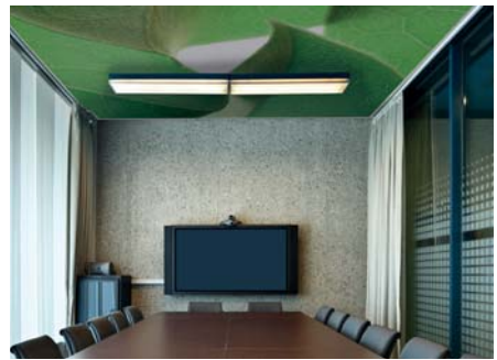
ADREA ADMG laurier rose