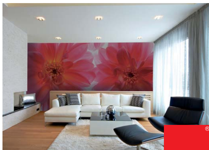
ADREA ADMG dahlias