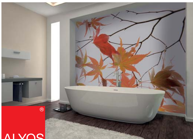
ADREA ADMG laurier rose