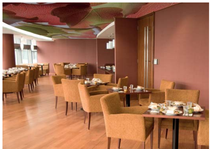
ADREA ADMG laurier rose