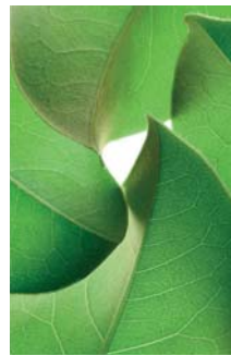
ADMG laurier rose