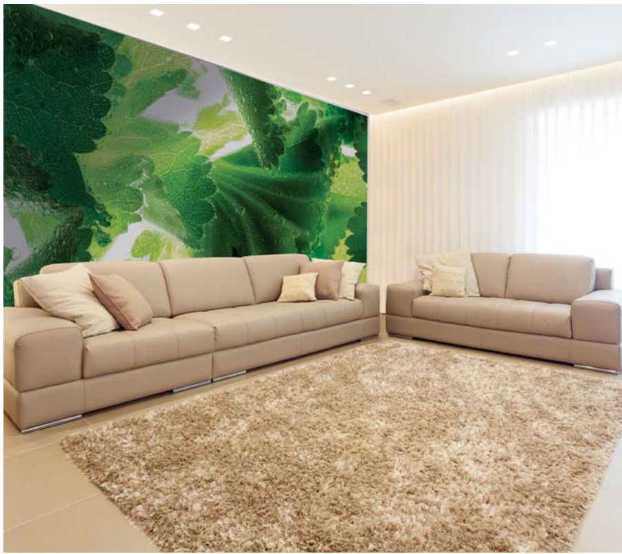
ADREA ADMG alchemille