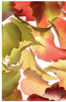
ADMG vigne vierge